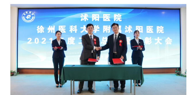
▲签订2022年度目标责任书

先后荣获“国家改善医疗服务示范医院”“江苏省文明单位”“江苏省老年友善医疗机构优秀单位”“宿迁市先进基层党组织”“母婴保健安全先进单位”等荣誉称号。 2021年,我们风雨同舟、众志成城,践行防疫责任担当。严格落实疫情防控措施,坚决筑牢防控屏障,先后选派31名医护人员驰援南京、扬州。 2021年,我们初心如磐,使命在肩,深化党史学习教育。为庆祝建党100周年,先后举办“重走长征路”“医心向党”主题党日、团建和文艺汇演活动。联合南京大学举办党史学习教育培训班,承办全市民营医院党建联盟会议,与南京信息职业技术学院马克思主义学院、塘沟镇谢河村开展党建互联共建