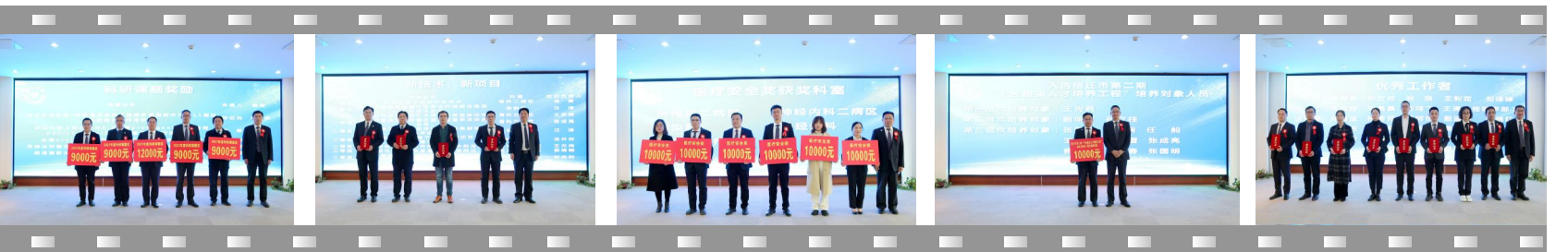
▲ 2021 年度科研课题奖励获奖代表 ▲ 2021 年度新技术、新项目一等奖获奖科室 ▲ 2021 年度医疗安全奖获奖科室 ▲ 宿迁市第二期“千名拔尖人才培养工程”第一层次培养对象 ▲ 2021 年度优秀工作者和先进工作者代表